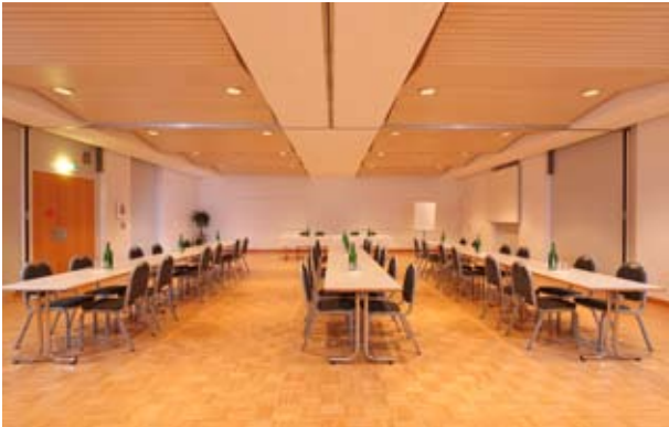
Anker/Bubenberg/Erlach mit Bankett-Bestuhlung

Lokalitäten, die sich exakt nach Ihren Bedürfnissen richten: Dank flexiblen Schiebewänden profitieren Sie von variablen Grössen. Die optimale Lösung für Ihre Gruppenarbeiten. Für einen anschliessenden Apéro ist unser Foyer der ideale Ort.