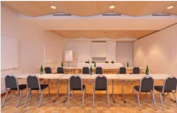
Anker mit Seminar-Bestuhlung