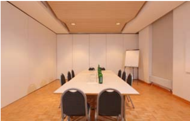
Bubenberg mit Block-Bestuhlung